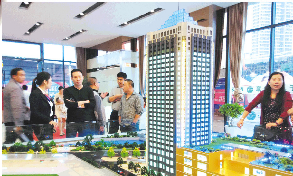
购房者在一处楼盘售楼处看房。