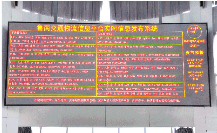
金兰信息平台电子显示屏。