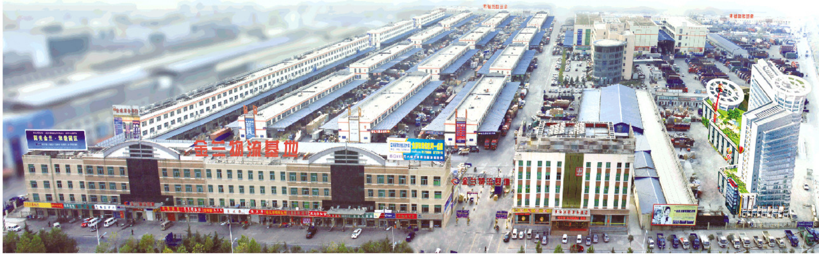
金兰物流实景鸟瞰图。