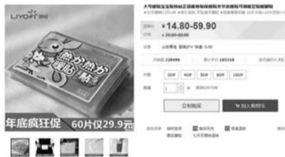
淘宝网上一卖家月销量高达228498笔。

当记者询问,为何没有质量合格证时,该摊主表示,“暖宝宝”是从批发市场进货的,其他的事情她并不清楚。“这个最高温度是63度,你隔着一层衣服贴上,不会有事情的。我从10月份就进货了,每天至少都卖十几包,你放心用就是,不会出事的,要是使用过程中觉得太热,扯下来就是,用温毛巾敷一敷就好了。”