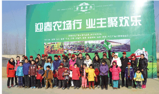
业主们在农场合影。

活动的第一站是参观泰盛恒农场，泰盛恒农场的工作人员早早地已经等候客户的到达。泰盛恒农场占地面积6000余亩地，一期