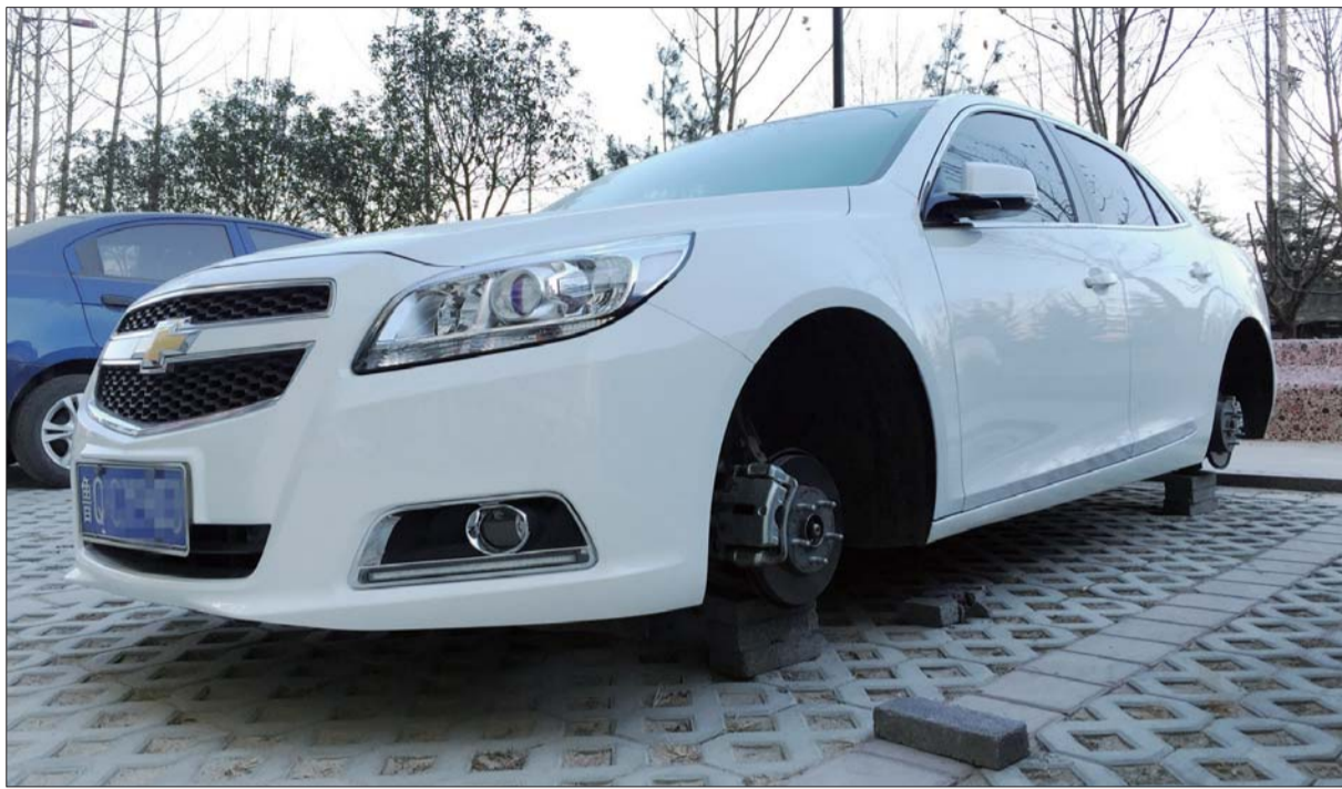
轮胎被卸后,车身用砖块垫起来。

本报1月19日热线消息(记者 徐升 英子)在临沂经济技术开发区一小区的沿街店铺门前停车位上,两辆白色轿车的7个轮胎在18日夜间被两名盗贼盗走,视频监控显示,盗窃实施时间仅33分钟。更令人烦恼的是,车轮被盗却不在保险理赔范围内,损失只能由车主自己承担。