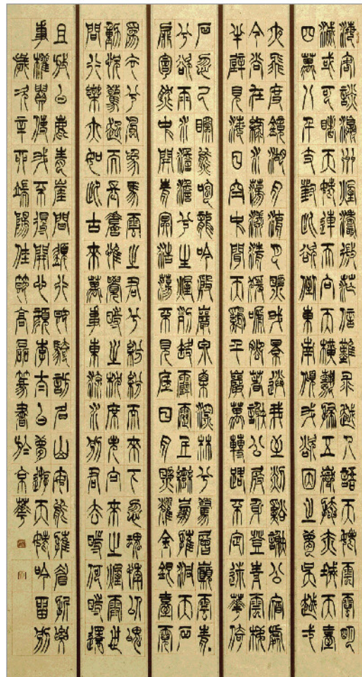
▲篆书李白诗《梦游天姥吟留别》