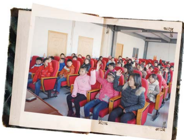
见面会上,小记者们争先恐后地举手发言。