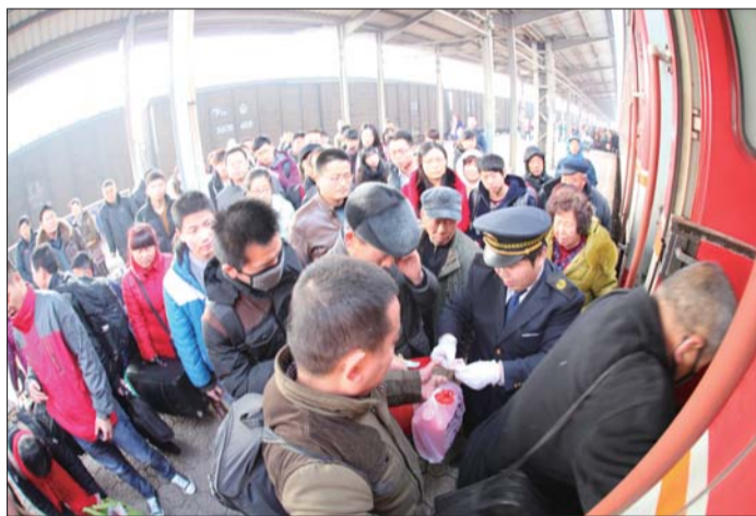
乘客依次登上火车。

春运期间热门车次为日照至北京的K52次、临沂至北京的K1902次、日照至牡丹江的K1450次、日照至济南的K8288、K8286、K8282次及枣庄西至烟台的5037次。