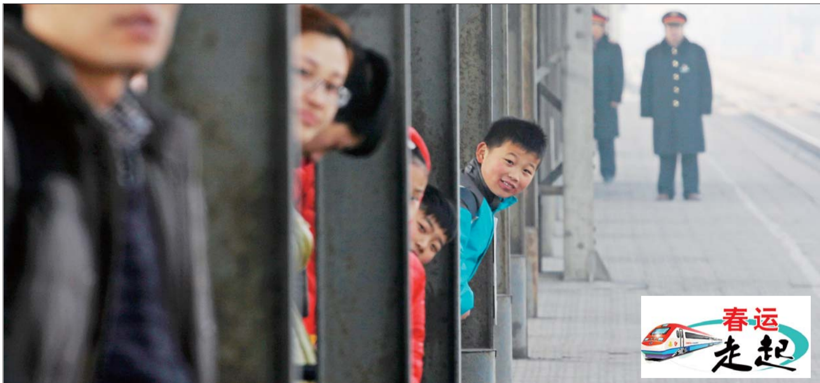
旅客在等待火车进站。