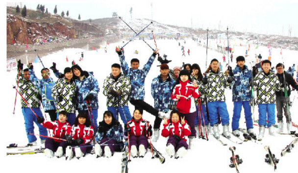
房德·钓鱼台第三季业主专享滑雪活动。

沂河岸最后多层电梯洋房；3大公园，万亩湿地；家门口24个运动球场；户型开间超同类产品15%，99.9%户型满意度；纯剪力墙结构，抗震裂度提高两级；儿童教育主题公园、续购超市等十余项专属配套；法式新古典建筑，沂河岸品质洋房标杆，一期100天狂销600套，稳坐南城销冠！ (王文卿)