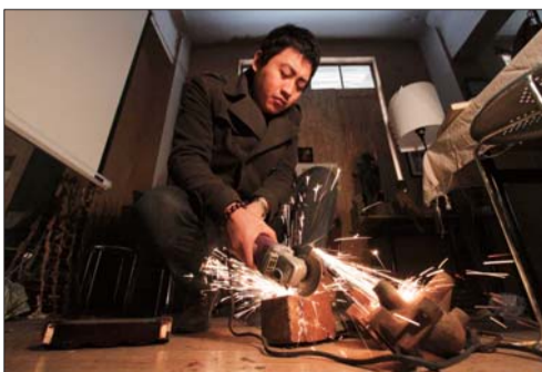
捡来的废品经过切割，变成造型独特的创作原料。