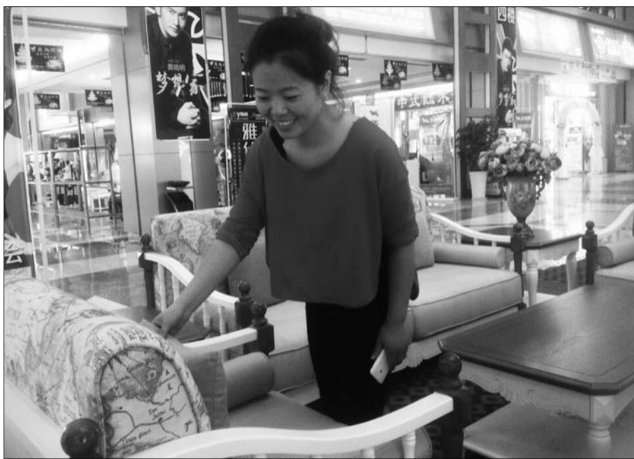
一位顾客在选购沙发。

“冬歇”过后,又到了一年家具采购的季节。记者在市内的多家家居卖场看到,已经有不少消费者在为春季的家装做准备,家具市场和商家也在千方百计地备战旺季,有商家喊出开年“最猛一降”的口号,而调查显示,消费者也对促销眼花缭乱,不知道什么时候出手才最为划算。