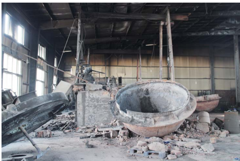
山东富隆铅业有限公司未完全清除的生产车间

为加强此项工作的监督管理,临沂严禁工地现场堆用于现场搅拌的砂、水泥等原材料。对于违规现场搅拌砂浆的,责令建设工地限期改正,逾期不改正的,处1万元以上3万元以下的罚款,并计入企业不良记录予以诚信扣分,建设工程也将不得参与建设工程评优活动。