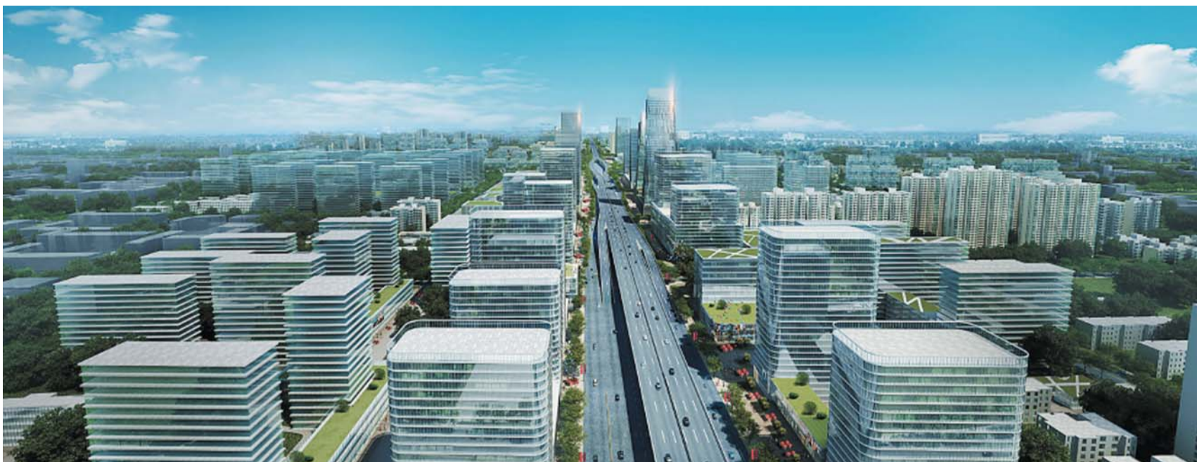
蒙山大道界面透视图。