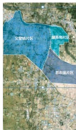
商贸物流区规划分成三个部分。

在市场和物流的发展战略上,规划提出市场要改造老市场区,打造新的国际市场群,走国际化、电商化、市场中心化路线。物流要建设国家级物流枢纽,构建与“国际化、电商化和中心化”战略相适应的现代物流体系。争取建设“国际陆港”,全面提升临沂国际物流平台。构建满足各类型经营需求的电子商务物流服务设施,集成与优化以中转物流、专线物流为核心,以铁路物流、航空物流、多式联运为重要补充的公共运输服务体系。