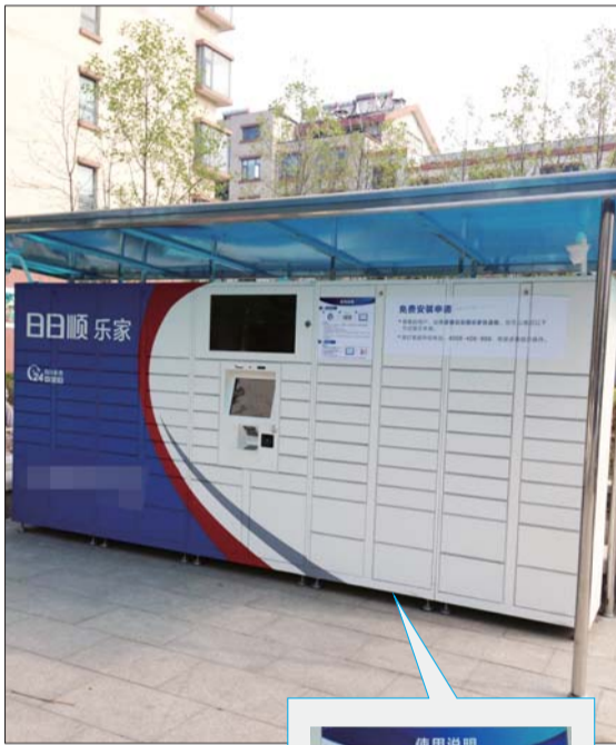
▲日日顺乐家的快递柜。