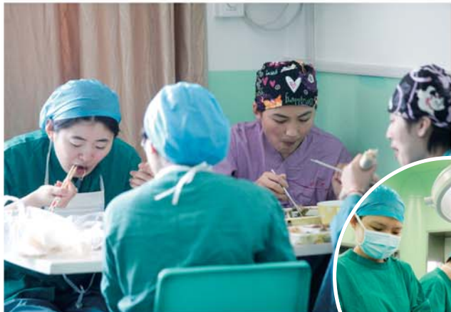
由于时间匆忙,手术室的护士们午饭都在休息室简单吃点。