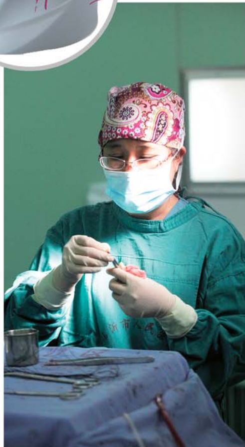
一位护士在手术台上紧张地忙碌。