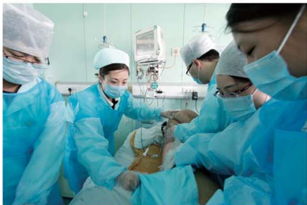
多名护士合力为一名刚刚进入ICU病房的患者护理。