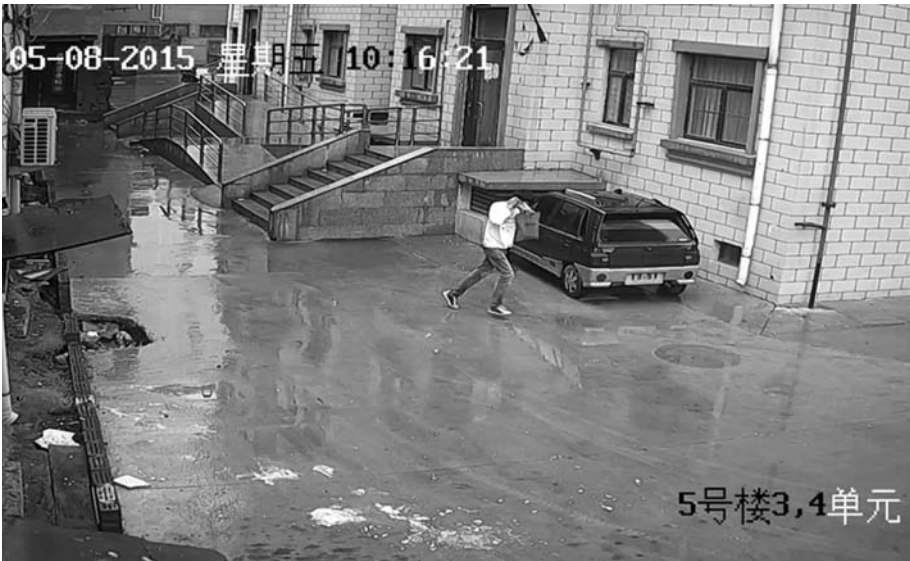
从王女士家出来,陆某边跑边戴口罩。(监控视频资料)