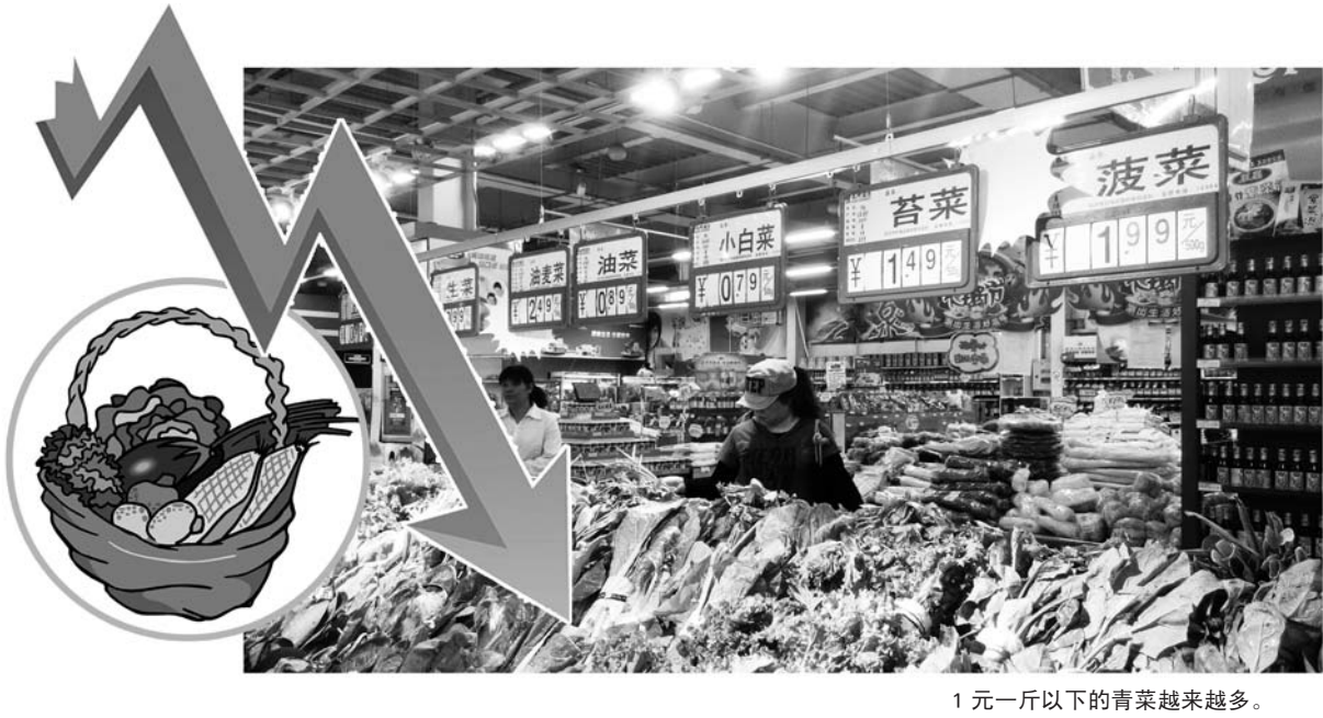
1 元一斤以下的青菜越来越多。

本报 5 月 21 日讯（记者 吴慧）随着气温的升高，和人们息息相关的菜篮子变得轻松了很多，近来，1 元菜品越来越多，鸡蛋降至 3.5 元一斤。 油菜 0.79 元/斤，油菜 0.89 元/斤，生菜 0.99 元/斤，上海青 0.99 元/斤……在市区沂蒙路一家大型超市青