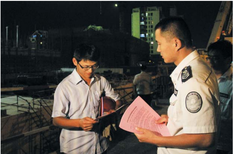
执法人员对工地夜间施工进行规范。

间到8日白天，多云，部分地区有雷雨或阵雨，风向由偏南风转短时偏北风，风力3到4级，雷雨地区雷雨时阵风可达7至8级，低温21℃，高温较前一天有所下降，为29℃。 目前正值初夏季节，天气多变，请考生和家长们密切关注最新的天气预报。本报预祝每一位考生都能正常发挥，金榜题名。