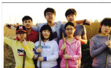
学生参加环保公益活动