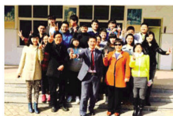
游学及升学指导讲座