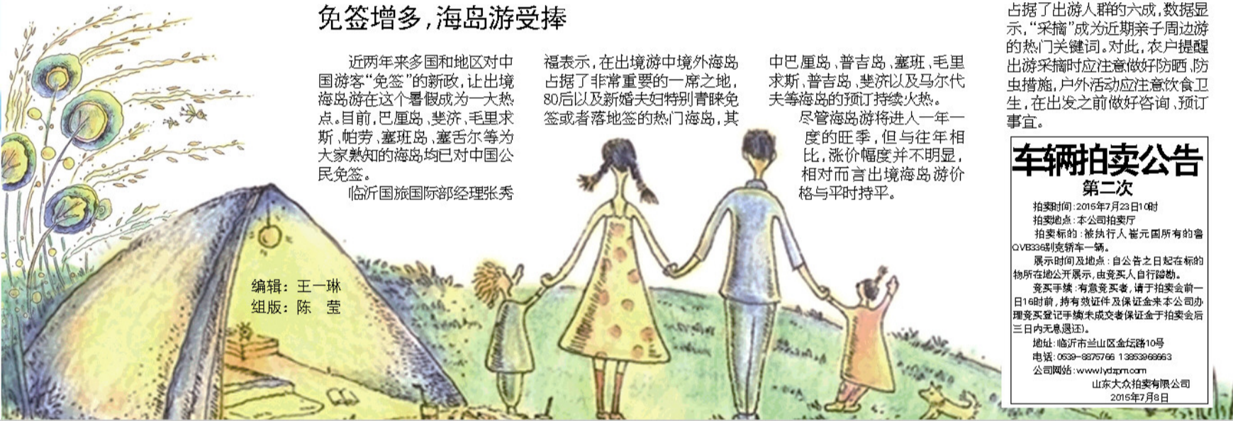
编辑：王一琳 组版：陈莹

尽管海岛游将进入一年一度的旺季，但与往年相比，涨价幅度并不明显，相对而言出境海岛游价格与平时持平。