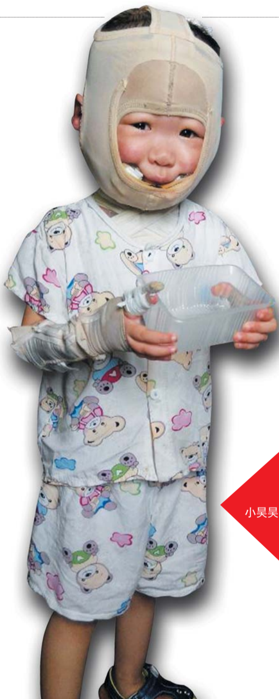
编辑/韩纪功 组版/朱雪天