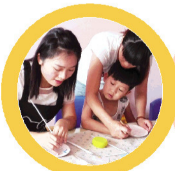
老师教小记者绘制素胚盘。

编辑点评：短短的文字，将做盘子的过程描写得非常详细，如果再将画马的过程和老师帮助的细节写出来就更好了。