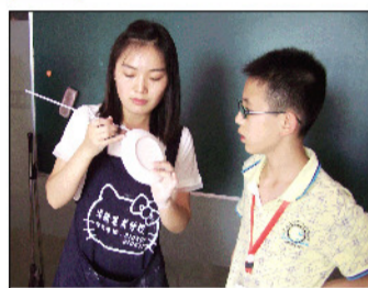
老师在为小记者的作品补釉。