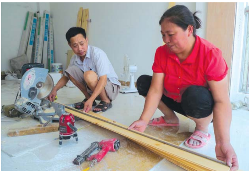
▲平时夫妇俩就是这样,互相依赖,相互扶持。