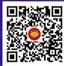
温和酒业微信订阅号