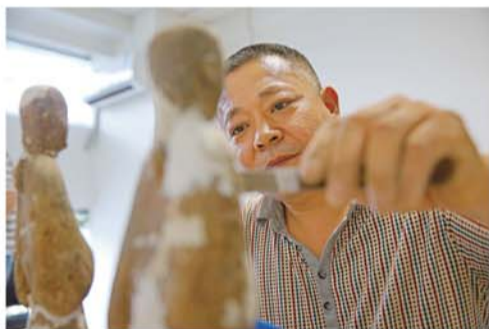
文物修复后，缺失的地方用石膏补配。