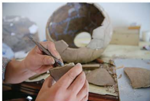
经过几天的修复，古陶器逐渐恢复本来面貌。