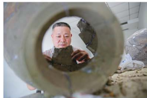
修复文物，不仅手工技艺方面要过关，同时也需要极大的耐心和毅力。