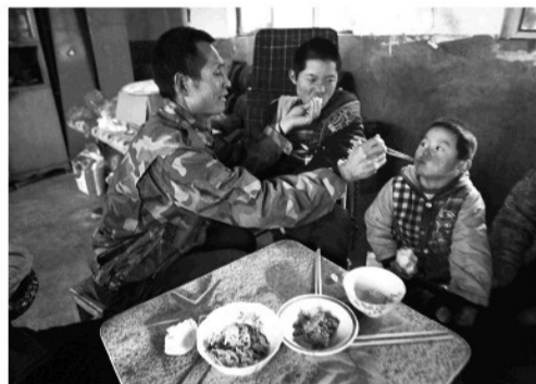
菜就是一家人的午饭。一盘清炒藕片和一盘咸菜。