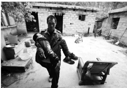
大儿子高超不但智商,而且不能行走,出来进去都要靠高洪抱着。